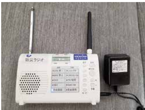
久山町の防災ラジオ

※防災行政無線テレフォンサービス 緊急放送が電話で確認できます。 (通話料無料) 0120(0)31(2)233