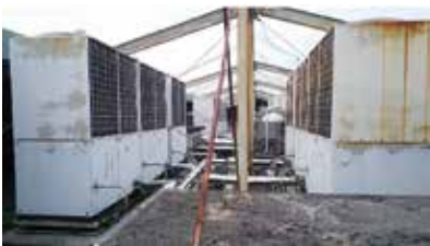
(設置から19年経過している空調設備 写真は屋上の室外機)