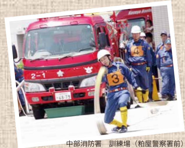
中部消防署 訓練場（粕屋警察署前）