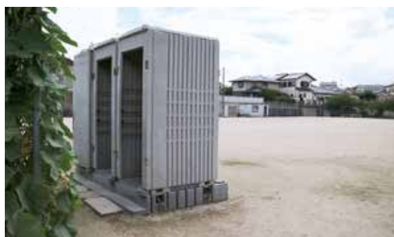
和田区 健康広場 簡易トイレ

問 九大の森駐車場は、広場から100メートル以上離れている。しかも道路を横断しなければならぬし、この道路で過去に2件の死亡事故が発生している。