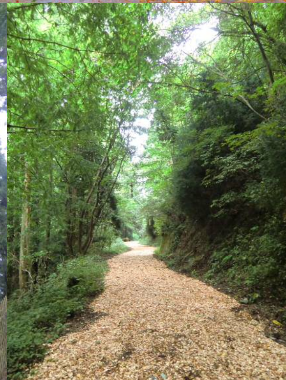
セラピーロード「落陽コース」